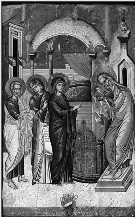
Ἡ φορητὴ εἰκόνα τοῦ 17 ου αἰῶνα (1669) τοῦ Χανιώτη ἱερομόναχου ζωγράφου Φιλόθεου Σκούφου.

Ἀξίζει νὰ ἀναφερθοῦμε ἐπίσης σὲ μία τοιχογραφία τοῦ Φώτη Κόντογλου στὸν Ναὸ τῆς Καπνικαρίας. Ὁ Φώτης Κόντογλου ἔφερε τὴν μεγάλη ἀλλαγὴ στὸ εἰκαστικὸ κλίμα τῆς ἐποχῆς του. Σήμερα, ἐξήντα χρόνια μετὰ τὸν θάνατό του (1965) παραμένει ἐπικαίριος καὶ σύγχρο-