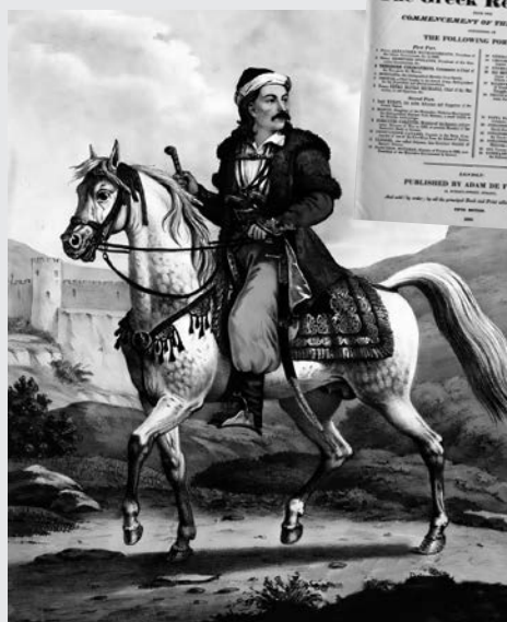
Λιθογραφία τοῦ Ἄνταμ Φρίντελ ἀπὸ τὸ λεύκωμα Adam Friedel, The Greeks. 24 Portraits , Λονδίνο 1830.

Μάλιστα, σὲ σύντομο διάστημα ἀπὸ τὴν ἄφιξή του: «διήγειρε τὸ μῖσος τῶν ἀρχόντων» καὶ «τὴν ἐπηρεμένην ὄφρῦν τῶν κοτζαμπάσπιδων τούτων ὁ Ὀδυσσεὺς κατέρριψε» καὶ κατεδίωξε καὶ διέλυσε τὶς κλέφτικες ὁμάδες, ἀνάγκασε δὲ τοὺς πῶ