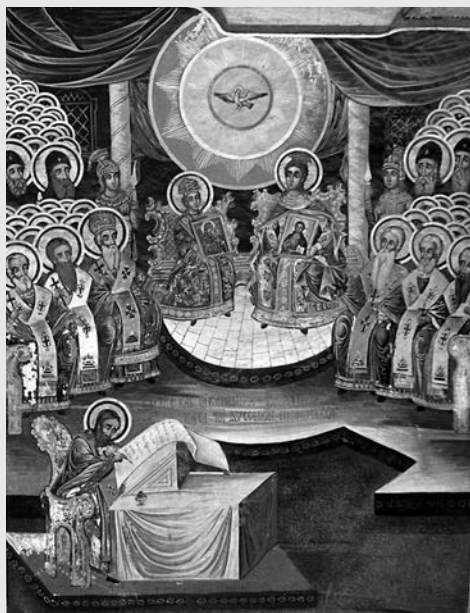
Τοιχογραφία ποὺ ἀπεικονίζει τὴ Ζ΄ Οἰκουμενικὴ Σύνοδο.